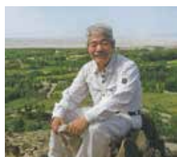
故 中村 哲医師