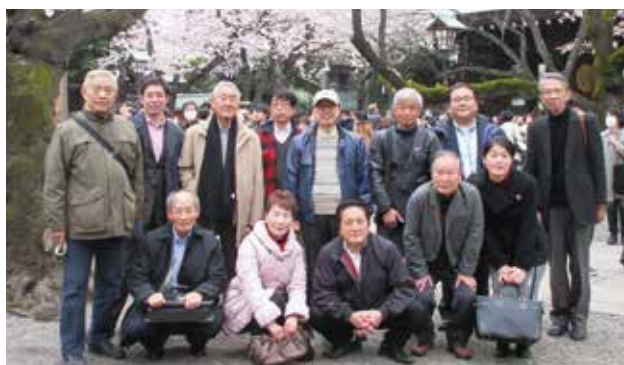
桜満開の靖国神社境内にて

支部総会開催に向けて支部役員会を年5回程度開催している。支部規約に評議員制度があり役員経験者や今後の役員候補者の方々に就任頂いており、役員会には評議員の方にもご出席頂き貴重なご意見を賜っている。役員は現在11名、評議員3名で構成され例年11月の総会開催に向けて活動、第1回役員会は3月末か4月初旬花見を兼ねて開催、その年度の総会日程と会場を決定。場所は都内市ヶ谷の飲食店で、靖国神社に程近く会議終了後同神社に参拝するのが定番となっている。