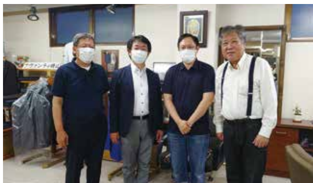
支部長事務所にて

昨年、北九州支部は再発足10年を迎え10月に開催をと、コロナ禍でも準備を進めてまいりましたが、卒業生にもコロナの影響を受け順延となりました。