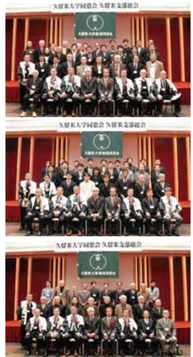
令和5年2月18日(土) ホテルニュープラザにて

また、無事開催出来ましたのは、役員の皆様及び関係各位の方々のご協力のお陰です。感謝申し上げます。