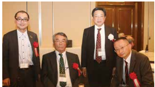
令和4年11月10日(木) 八仙閣にて