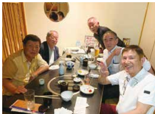
令和5年5月18日(土) 割鮮 吉左門にて

2023年5月18日に関西支部第1回の役員会を開催しました。その中でコロナ禍で中断していました、総会の開催について役員全員の賛成の元、開催が決定しました。