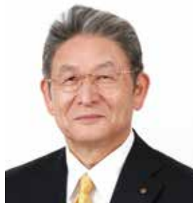
福岡市議会議長 打越 基安 (昭和52年商学部24回卒)

まずは、この度の豪雨洪水において被災された多 くの久留米市民の方々、同窓生及びそのご家族の 皆様に心よりお見舞い申し上げます。一日も早いご 回復を願っております。